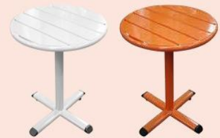
TABLE BISTROT Ø 65 CM

Lames en tôle acier soudées sur l'ossature. Piètement tubulaire en acier Ø 60 mm. Tubes oblongs en acier 60 x 30 cm. 10,36 kg.